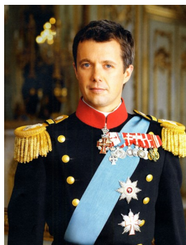
Æresformand Hans Kongelige Højhed Kong Frederik

Foreningens formål er at styrke nationens interesse for søværnet og søfarten, samt vedligeholde forbindelsen og kammeratskabsfølelsen mellem personer, der er eller har været tjenestgørende under orlogsflaget, ansat til søs eller nærer særlig interesse for det maritime miljø